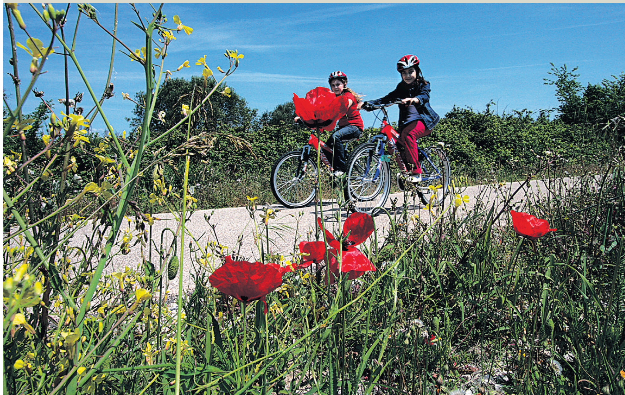
Kinderen pendelen over de Sentiero della Bonifica.

Pas vlak voor de poort van Chiusi raken we het spoor even bijster op dit verder zo goed aangegeven parcours. Het kan de pret niet drukken en even later sporen we vrolijk terug naar het beginpunt. Voor deel 2 nemen we eerst het treintje naar Arezzo. Onze fietsen staan er koninklijk bij, vlak naast onze stoelen. Terwijl het landschap ver-glijdt, verhaalt de conducteur over 'toen'. Toen FC Twente 'zijn' Juventus versloeg, zo'n dertig jaar geleden. Alsof de verwerking van die pijn nog steeds gaande is. Maar buiten is de pijn aanzienlijk verser. Voor de overwegbomen, gesloten ter ere van ons boemeltje, staat de vluchter in