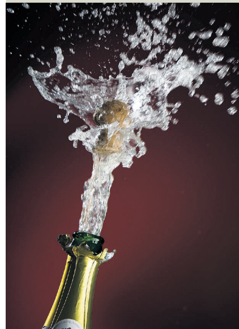
Bubbels laten de kurken knallen en de kassa rinkelen.