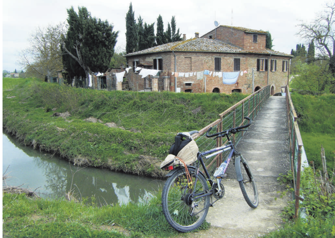
Sommige stadjes zijn met speciale fietspaden op de hoofdroute aangesloten.

Monic Slingerland en Diet Groot-huis zijn allebei op vakantie. De column van Monic verschijnt weer op 21 augustus, Diet! een week later.