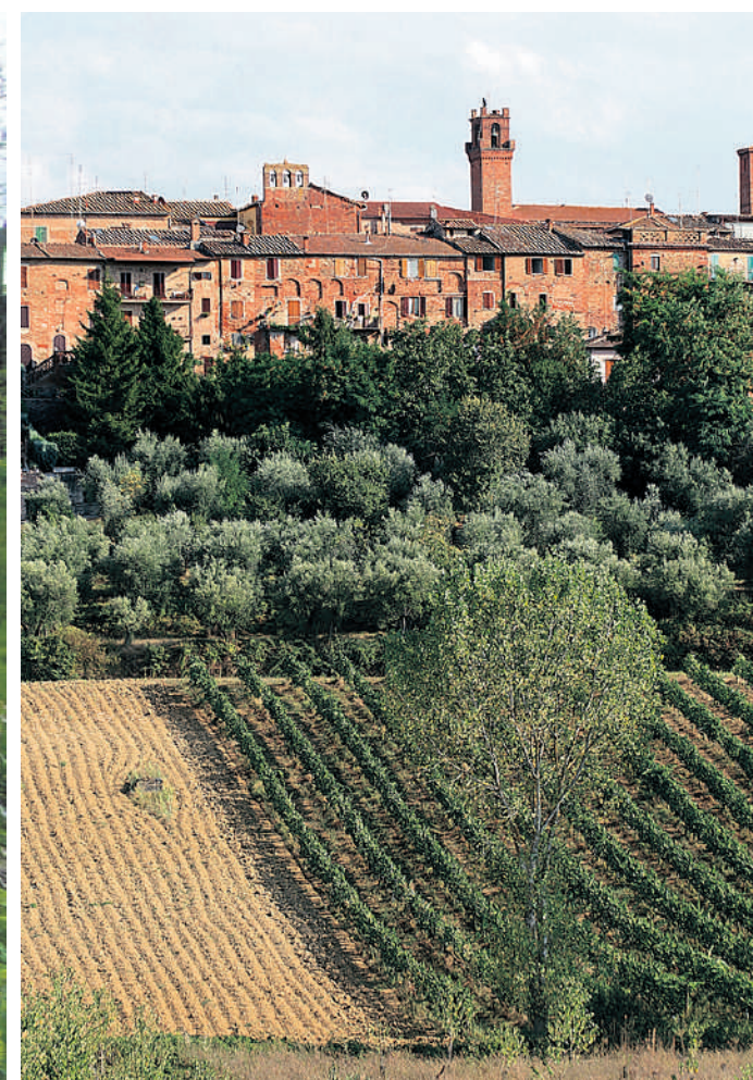
Zicht vanaf het Canale Maestro op het dorpje Torrita di Siena.