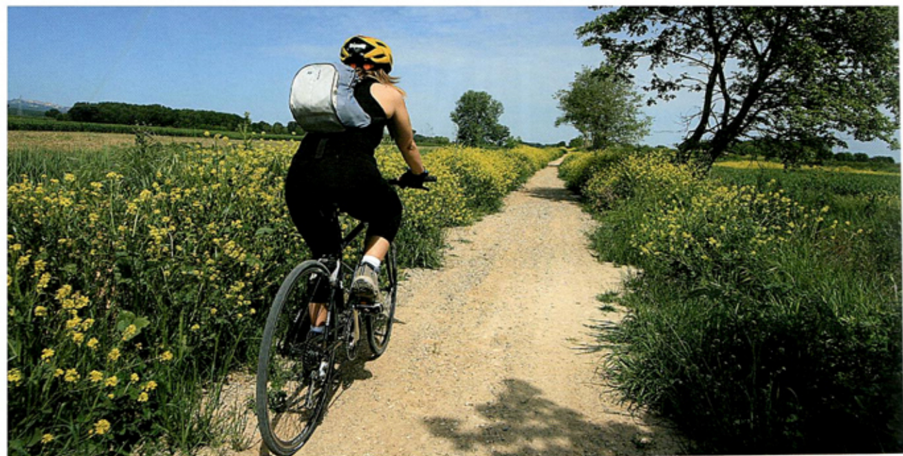
Il Sentiero prodece tra i campi incolti e coltivati, segni di storia in lontananza.

zo e di Chianciano Terme Valdichiana, nonché ai comuni di Arezzo, Civitella, Monte San Savino, Lucignano, Castiglion Fiorentino, Cortona, Chiusi, Sinalunga, Torrita di Siena e Montepulciano, a dar vita al progetto di valorizzazione del sentiero.