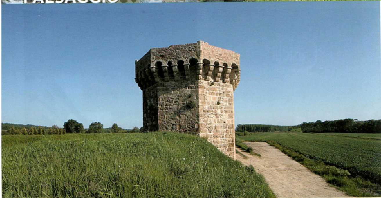
Il Sentiero della Bonifica, la Torre di Beccati.